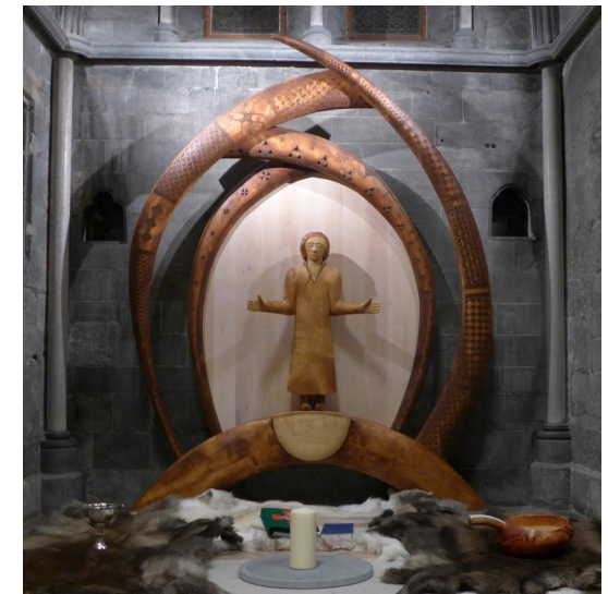
Samisk alter i Nidaros domkirke

Det vil bli et eget ungdomsprogram på lørdag. Informasjon om mer utfyllende program publiseres så snart det er klart.